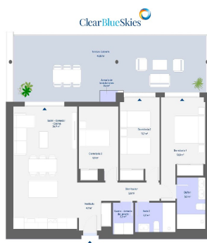
Residencial Abora Btg 1 Planta 2ª Lateral D 3 Dormitorios