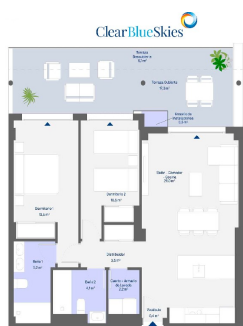
Residencial Abora Bis 2 Planta 2ª Letra C 2 Dormitorios